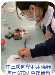
中三級同學利用儀器進行 STEM 專題研習

除了常規課程外，學校亦讓對 STEM 有濃厚興趣的同學參加 STEM Club，同學現正積極籌備參加 micro:bit 火箭車模型比賽、2021 VTC STEM 挑戰盃、2021 趣味科學比賽及全港學生鑑證科學大賽 2021，希望同學能發展潛能，發揮創意，在 STEM 的領域上有更豐富的體驗。