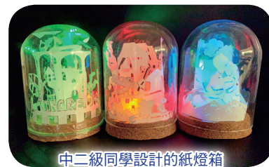
中二級同學設計的紙燈箱

除了常規課程外，學校亦讓對 STEM 有濃厚興趣的同學參加 STEM Club，同學現正積極籌備參加 micro:bit 火箭車模型比賽、2021 VTC STEM 挑戰盃、2021 趣味科學比賽及全港學生鑑證科學大賽 2021，希望同學能發展潛能，發揮創意，在 STEM 的領域上有更豐富的體驗。