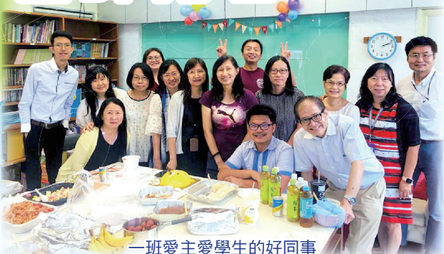
一班愛主愛學生的好同事

執教鞭多年，我跟女子籃球隊及游泳隊並肩作戰，參加了不少比賽，不但提高了同學的技術，更重要的是增加彼此認識，情誼更深。在主恩最後六年，我分別成為了6C班及6D班的班主任，你們天真的笑臉常在我腦海中浮現，我永遠不會忘記跟你們一起走過的日子。