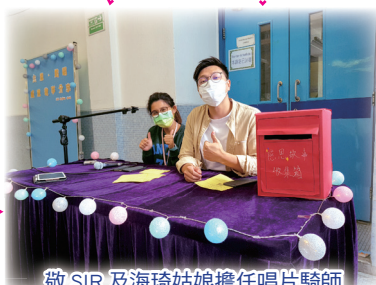
敬 SIR 及海琦姑娘擔任唱片騎師