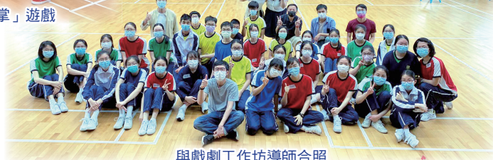
與戲劇工作坊導師合照