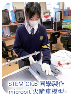
STEM Club 同學製作 micro:bit 火箭車模型

本校持續優化校本 STEM 課程，本年度嘗試與視覺及藝術科組合作，於中二綜合科學課堂中，結合電學原理及紙雕技巧，讓同學製作精美的紙燈箱。過程中不但能應用所學，更能體會不同學科之間的關聯。除此以外，中三同學亦從物理、化學、生物及電腦中挑選一科作為 STEM 專題研習科目，透過應用 micro:bit 及 3D 打印等技巧，解決生活上的困難。