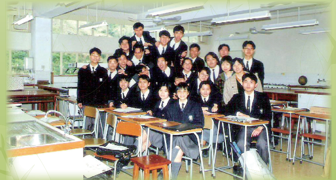
與我的第一班化學學生同行，備戰高考

School Motto: Self-discipline through the understanding of the Word, Service to mankind through faithfulness to the Lord