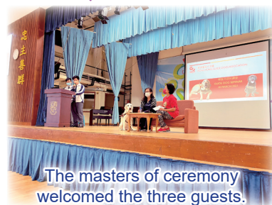
The masters of ceremony welcomed the three guests.

The seminar ended with calls for support for HKGDA and some dos and don'ts for citizens when they interact with guide dogs and their users. Like how the guide dog and its counterparts illuminate many lives of the visually challenged, this activity sheds light on how different stakeholders play a part in creating a harmonious society. Appreciating the precious chance to learn outside the classroom, all participating students found the activity illuminating as they learnt about how animals could make a difference.