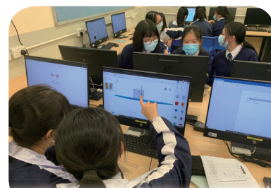
中三級同學利用電腦進行 STEM 專題研習