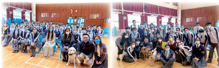
While the seminar ended here, the journey of developing bonding and compassion for animals is lifelong.